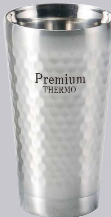
タンブラー 名入れイメージ