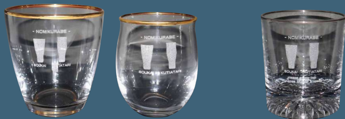
ミニビアグラス 名入れイメージ