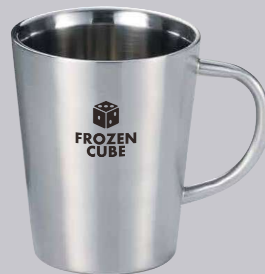
マグ 名入れイメージ