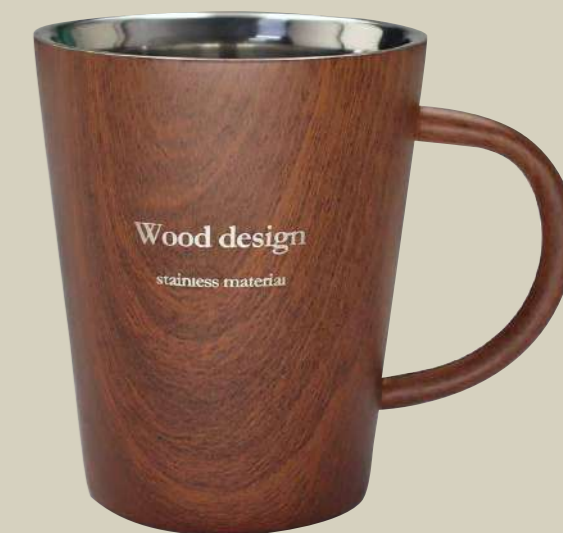
木目マグ 名入れイメージ

外側の木目調デザインと鏡面仕上げをした 内側のステンレス素材の光沢感、金属と木のコントラストが 落ち着いたドリンクタイムを演出します。 美味しい温度を保つ保温保冷の中空二層構造です。