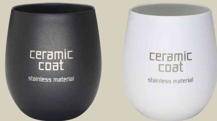
真空カップ 名入れイメージ